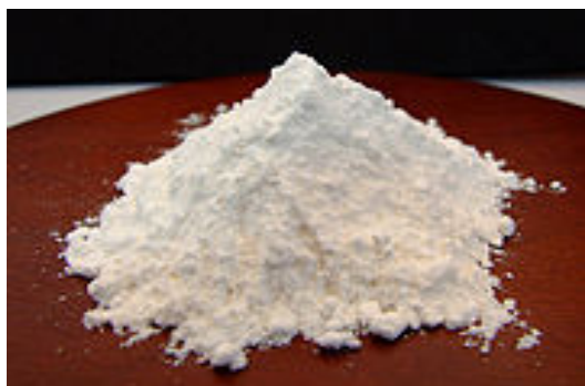
コンニャク・パウダー