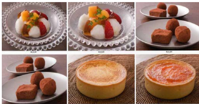
パン、ケーキ、デザート等試作例